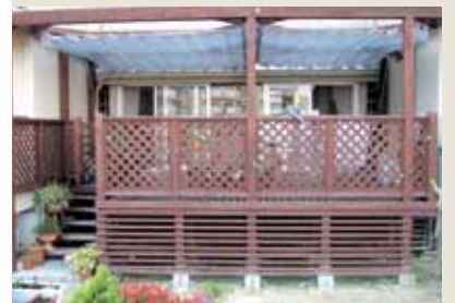
グループホーム「ハーモニーあかさか」 〒590-0144 大阪府堺市南区赤坂台3丁目9番23棟101号 TEL 072-290-0027 FAX 072-290-0027