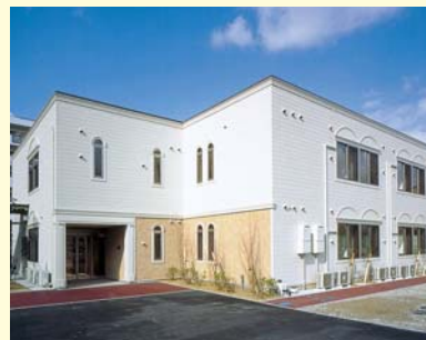
グループホーム「ハーモニープラザ」 〒599-8124 大阪府堺市東区南野田35番地 TEL 072-230-0055 FAX 072-230-5555