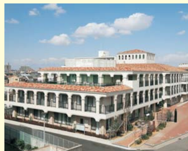
特別養護老人ホーム「ハーモニー」 「ハーモニーエスぺランサ」 〒599-8124 大阪府堺市東区南野田33番地 TEL 072-239-0011 FAX 072-239-0156